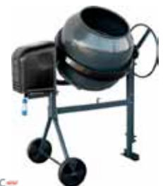
HORMIGONERA HCS-250 270L 1000W