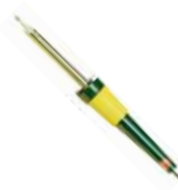
SALKI SOLDADOR ELECTRICO PROFESIONAL 40W