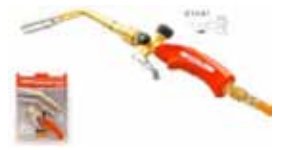
SUPER EGO SOPLETE ENCHUFE RAPIDO 14-22