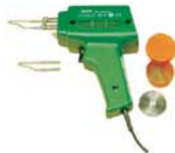
SALKI SOLDADOR ELECTRICO INSTANTANEO 100W