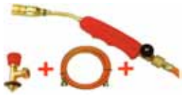
SUPER EGO SOPLETE ECO