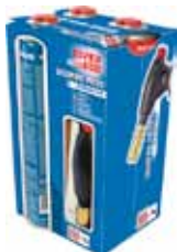
SUPER EGO PACK SOPLETE ROFIRE 3 cargas P005555