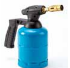
SUPER EGO SOPLETE TIPO PISTOLA 254590100