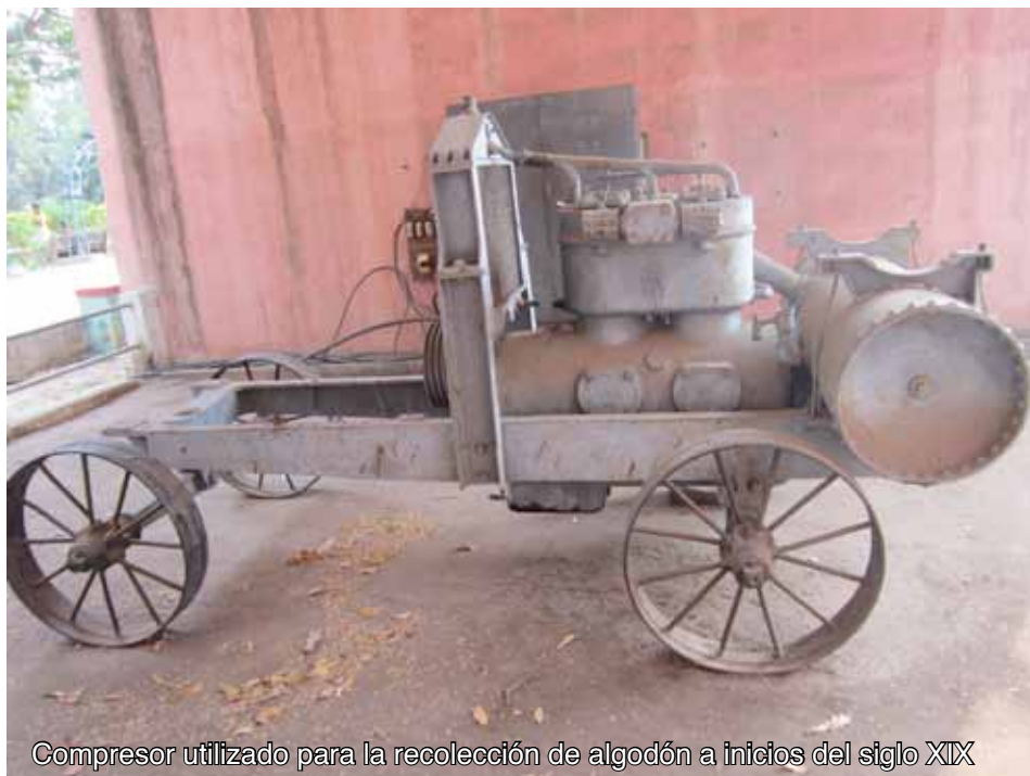
Compresor utilizado para la recolección de algodón a inicios del siglo XIX

Los compresores tienen una larga historia, que podríamos considerar que empieza cuando los antiguos herreros desarrollaron el fuelle, la primera máquina que producía aire para avivar el fuego, alrededor del año 4000 a.C.