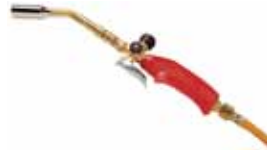
SUPER EGO SOPLETE BUTANO PROPANO AIRPROP PLUS