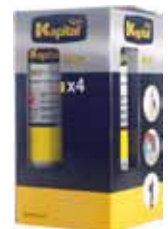
Kapital PACK 4 BOTELLAS GAS KMAPPLUS-4P 1L