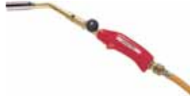
SUPER EGO SOPLETE BUTANO PROPANO AIRPROP