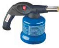
NORMAFUELS SL SOLDADOR A CARTUCHO 8700