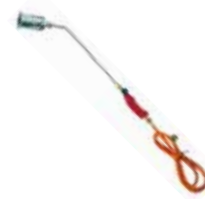
SUPER EGO SOPLETE CHAMUSCADOR 253000116