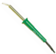
SALKI SOLDADOR ELECTRICO Disponible 30, 40, 60 y 80W