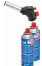
SUPER EGO PACK SOPLETE MULTIFIRE + 2 CARGAS