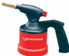
SCHWABERGER SOPLETE ROFLAME PIEZO