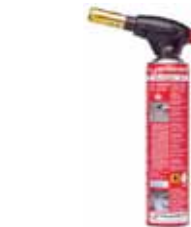
SCHWABERGER SOPLETE SEGOFIRE PIEZO