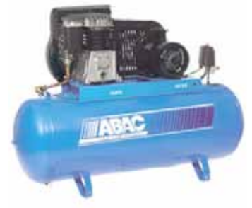
COMPRESOR CORREAS PRO A39B-270-FT3 3HP 270L