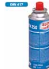
SUPER EGO CARTUCHO GAS COCINA Y BARBACOA