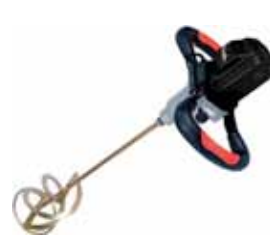
MEZCLADOR M-1280N + VARILLA + MALETA 1200W