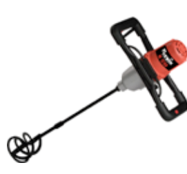
RUBIMIX 9 BL + VARILLA 1200W