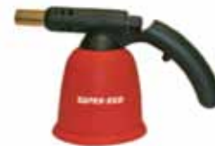
SUPER EGO SOPLETE CANDILEJA PIEZO ELECT. SEH025100