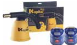
Kapital PACK SOPLETE CANDILEJA KT527P + 2 CARTUCHOS