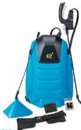
MATABI PULVERIZADOR ELECTRICO E+NG 15L