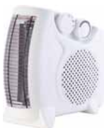
CALEFACTOR VERTICAL HORIZONTAL 1000/2000W