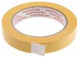
3M CINTA KREPP EXTERIOR 50MX24MM