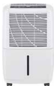
DESHUMIDIFICADOR DN-16-E 2,8L