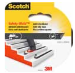
3M CINTA ANTIDESLIZANTE 4301 4,5MX25MM NEGRA