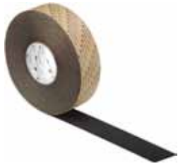
3M CINTA ANTIDESLIZANTE ANA Disponible NEGRA 20MX25MM Y 20MX50MM