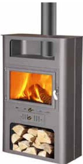
ESTUFA LEÑA 584 BURDEOS Disponible 18KW