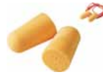
3M TAPON AUDITIVO 1110