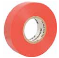
3M CINTA AISLANTE 1300 Disponible 20MX19MM NEGRA, ROJA, BLANCA Y AZUL