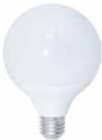
GLOBO LED E27/14W Disponible 3000K LUZ CALIDA, 6000K LUZ FRIA