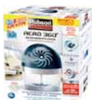
DESHUMIDIFICADOR AERO 360°