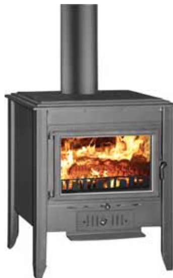
ESTUFA LEÑA 700 BARCELONA Disponible 18KW