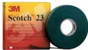
3M CINTA AUTOSOLDABLE SCOTCH 23 9,15MX19MM