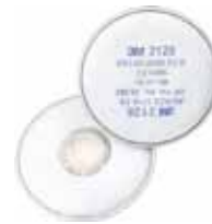
3M FILTRO 2128 P2R PARA MASCARA 6200/6800