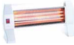
MARCA ESTUFA CUARZO 3 TUBOS 400/800/1200W