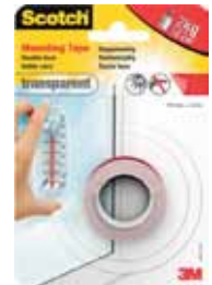
3M CINTA DOBLE CARA SCOTCH TRANSPARENTE 19MMX1,5M