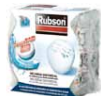
RECAMBIO TABLETA DESHUMIDIFICADOR COMPACT 300G