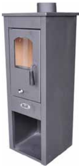
ESTUFA LEÑA N2 5-7KW