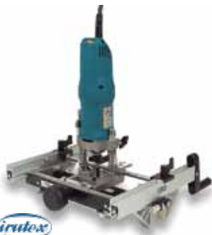
Virtex FRESADORA FR-129-VB 1000W