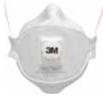
3M MASCARILLA 9332+ FFP3 NR D