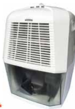
DESHUMIDIFICADOR DF-12-A 12L