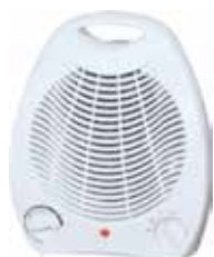
CALEFACTOR VERTICAL 1000/2000W