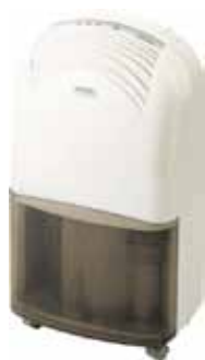
DESHUMIDIFICADOR STYLE 16-M 4,5L