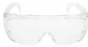
3M CUBREGAFA VISITOR PC