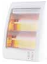
MARCA ESTUFA CUARZO 2 TUBOS 400/800W