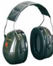
3M PROTECTOR OÍDOS OPTIME II