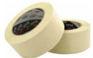
3M CINTA KREPP 201E 90° Disponible 50MX18MM, 50MX24MM, 50MX30MM, 50MX36MM, 50MX48MM