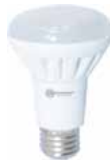
LAMPARA REFLECTORA R63 LED E27 Disponible 6000 LUZ FRIA, 3000K LUZ CALIDA