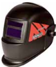
MOYTER PANTALLA SOLDAR ELECTRONICA OPTIMATIC 055