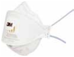
3M MASCARILLA 9322+ FFP2 NR D