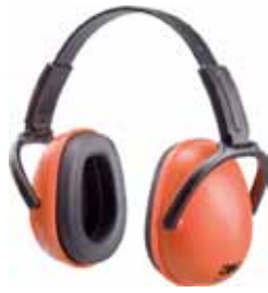
3M PROTECTOR OÍDOS 1436