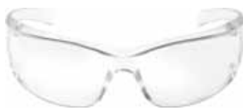
3M CUBREGAFA VIRTUACL PC