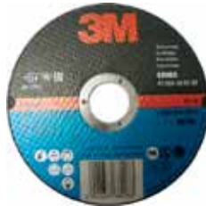
3M DISCO CORTE T41 115X1,0MM