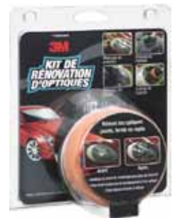
3M KIT RESTAURACION FAROS COCHE