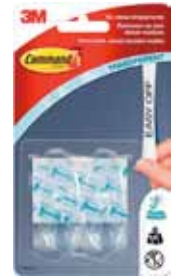
3M GANCHO COMMAND 17091 Disponibile 2UD + 4TIRAS