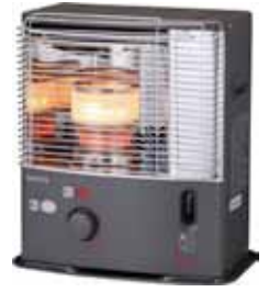
ESTUFA QUEROSENO KSP 270 CE A 2700W