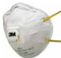
3M MASCARILLA 8812 FFP1