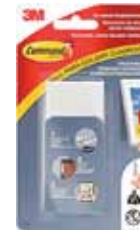
3M TIRA ADHESIVA COMMAND 17206 Disponibile 8PIEZAS NEGRAS, BLANCAS