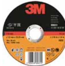
3M DISCO CORTE T41 INOX Disponibile 115X1,0MM, 125X1,0MM Y 230X2,0MM