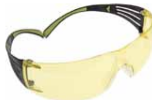
3M GAFA SF403AF PC