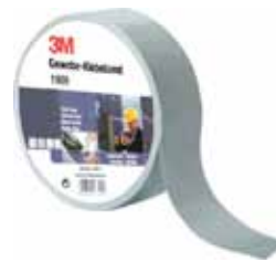
3M CINTA AMERICANA 1909P50 50MX50MM 0,28MM PLATA