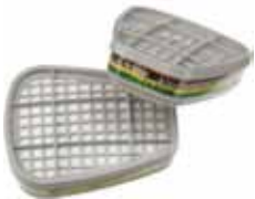
3M FILTRO 6059 ABEK1 P/MAS- CARA 6200/6800