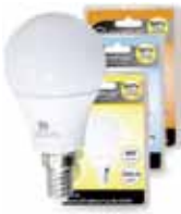
LAMPARA ESFERICA LED E14/E27/4W Disponible 6000K LUZ FRIA, 3000K LUZ CALIDA