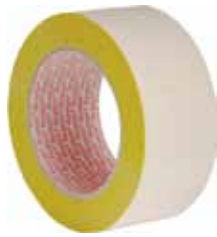
3M CINTA MOQUETA REMOVIBLE 25MX50MM