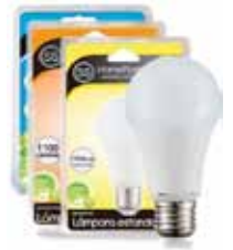
LAMPARA STANDAR LED E27/11W Disponible 6000K LUZ FRIA, 3000K LUZ CALIDA