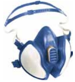
3M MASCARA 4255 FFA2P3 R D