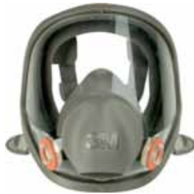
3M MASCARA 6800S SIN FILTROS