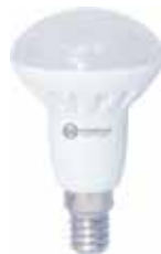
LAMPARA REFLECTORA R50 LED E14 Disponible 6000K LUZ FRIA