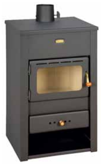
ESTUFA LEÑA K-2 Disponible 49X45X81