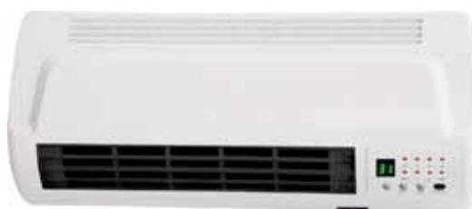
CALEFACTOR SPLIT-MURAL S-10/20-MD 1000W-2000W