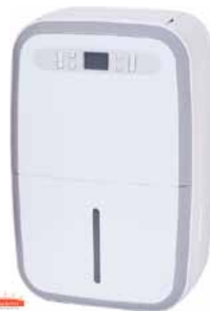
DESHUMIDIFICADOR CON CALEFACCION DN 35-RE 35L