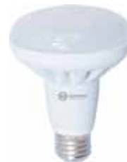
LAMPARA REFLECTORA R80 LED E27 Disponible 6000K LUZ FRIA, 3000K LUZ CALIDA