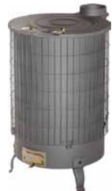
ESTUFA MIXTA N2 Disponible 14,0KW, 14,5KW Y 15,0KW