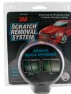
3M KIT ELIMINADOR ARAÑAZOS COCHE