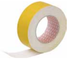
3M CINTA MOQUETA 25MX50MM