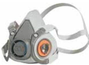
3M MASCARA 6200 SIN FILTROS