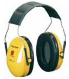
3M PROTECTOR OÍDOS PELTOR OPTIME I