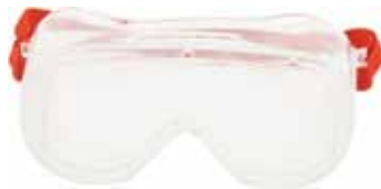
3M GAFA 4800 PC