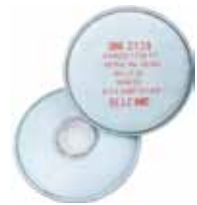
3M FILTRO 2138 P3 VO GA PARA MASCARA 6200/6800