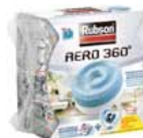
RECAMBIO TABLETA DESHUMIDIFICADOR AERO 360° 450G