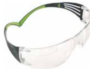
3M GAFA SF401AF PC