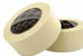
3M CINTA KREPP 101E Disponible 50MX18MM, 50MX24M M, 50MX30MM, 50MX36MM, 50MX4 8MM