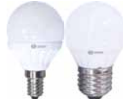
LAMPARA ESFERICA LED E14/E27/7,5W Disponible 3000K LUZ CALIDA, 4200K LUZ DIA, 6000K LUZ FRIA