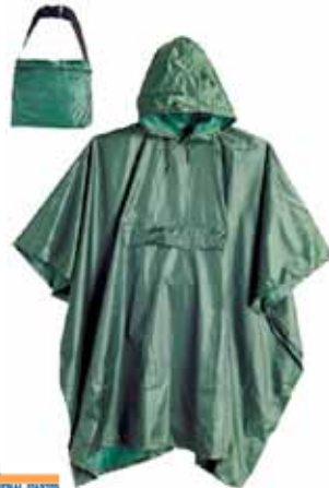
INDUSTRIAL STARTER PONCHO IMPERMEABLE 1510 T-U VERDE