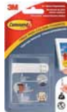
3M TIRA ADHESIVA COMMAND 17202 Disponibile 8PIEZAS BLANCAS, NEGRAS