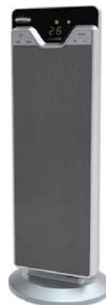
CALEFACTOR CERÁMICO SUELO TE-2200 2200W