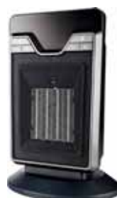
CALEFACTOR CERÁMICO SOBREMESA SE-2000 2000W