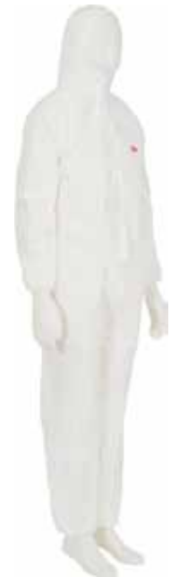
3M BUZO DESECHABLE P4515B Disponible T-L, T-XL, T-XXL, T-3XL