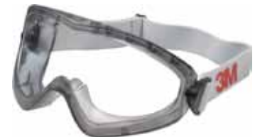
3M GAFA G2890