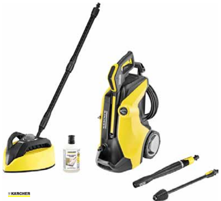
KARCHER HIDROLAVADORA K-7 FC HOME T450 160BAR 600 L/H