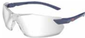
3M GAFA G2820 PC