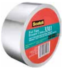
3M CINTA ALUMINIO SCOTCH 46MX50MM