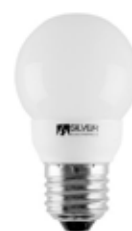
LAMPARA ESFERICA/ PEQUEÑA E27/09W E27/09W