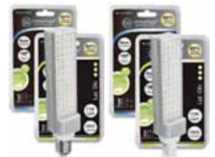
LAMPARA PL LED 6400K Disponible E27, G24