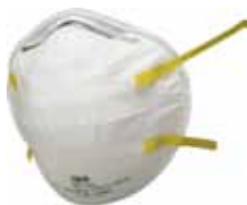
3M MASCARILLA 8710 FFP1