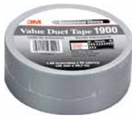
3M CINTA AMERICANA 1900 Disponible 50MMX50M 0,15MM NEGRO Y PLATA