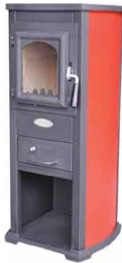
ESTUFA LEÑA N3 5-7KW