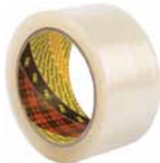
3M CINTA EMBALAJE 309 66MX48MM