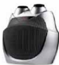
CALEFACTOR CERÁMICO SOBREMESA CH-18-M