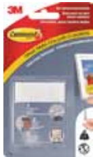
3M TIRA ADHESIVA COMMAND 17201 Disponibile 8PIEZAS BLANCAS, NEGRAS