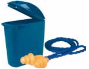
3M TAPON AUDITIVO 1271