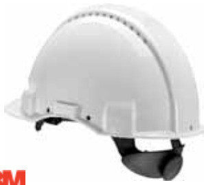
3M CASCO SEGURIDAD H700 Disponible ROJO Y BLANCO