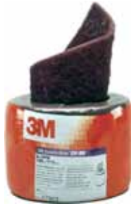
3M ROLLO PRECORTADO SCOTCH-BRITE 61092 VERDE