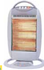
MARCA ESTUFA HALOGENA GIRATORIA 400/800/1200W