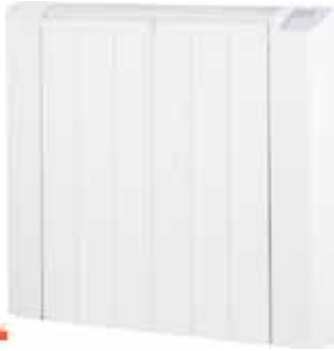
EMISOR TÉRMICO ECH Disponible 1500W, 2000W