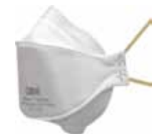
3M MASCARILLA 9310+ FFP1 NR D