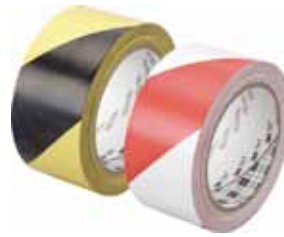
3M CINTA VINILO ADHESIVA Disponible 50MMX33M AMARILLO/ NEGRO Y ROJO/BLANCO