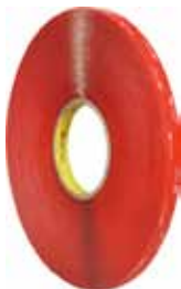
3M CINTA DOBLE CARA VHB 13,7MX19MM