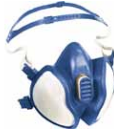
3M MASCARA 4251 FFA1P2 R D