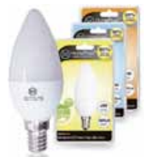
LAMPARA VELA LED E14/4W Disponible 3000K LUZ CALIDA, 6000K LUZ FRIA