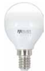
LAMPARA ESFERICA LED E14/E27 Disponible 3000K, 5000K