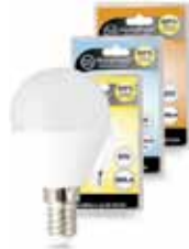
LAMPARA ESFERICA LED 6W Disponible E14 4200K, E27 4200K