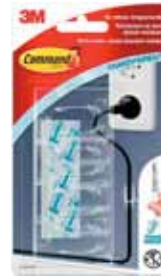
3M GANCHO COMMAND 17301 Disponibile 8UD + 12TIRAS