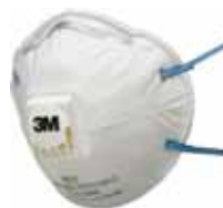
3M MASCARILLA 8822 FFP2 NR D